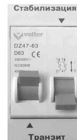
Рис.7 Режим «Транзит».

4. Включите автоматический выключатель. Рычаг выключателя перевести в верхнее положение.