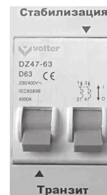
Рис. 7. Отключены оба режима.

В режиме «Транзит» на выход стабилизатора подается нескорректированное входное напряжение, но и в этом режиме обеспечивается защита от перенапряжения на уровне 260 \pm 5\text{В} .