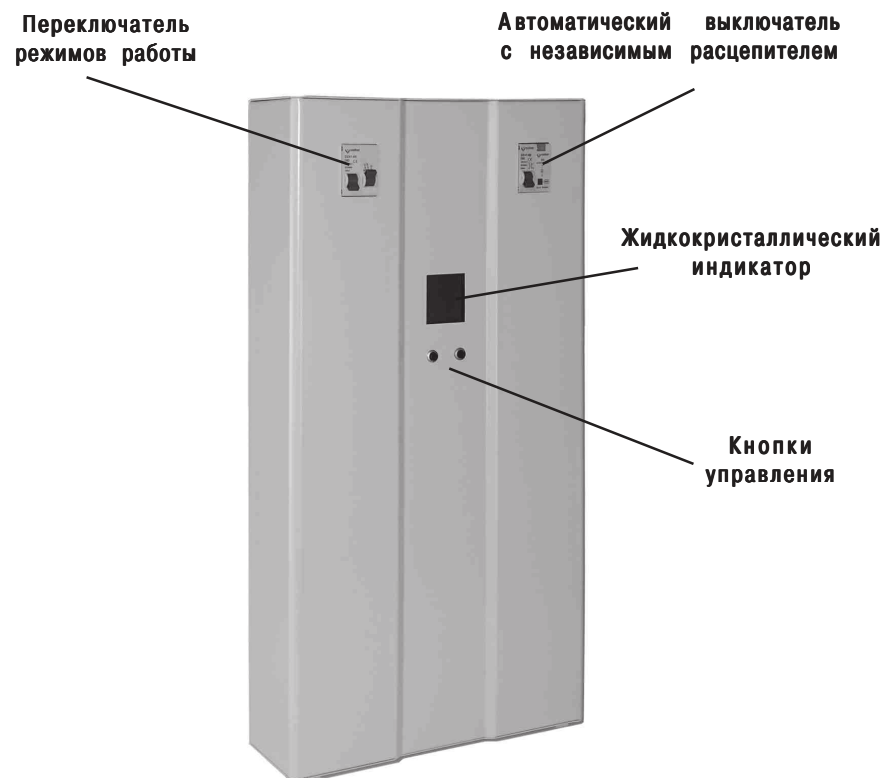
Рис. 1. Стабилизатор напряжения

В верхней части расположен клеммник, для подключения стабилизатора, закрытый крышкой. Там же расположен заземляющий контакт.