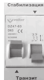
Рис. 8. Режим «Транзит»