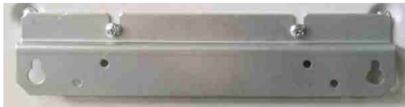
Рис. 2 Крепежная планка

Для размещения стабилизатора на стене сначала монтируется крепежная планка (Рис.2), потом на нее подвешивается аппарат и производится подключение токоведущих проводников. Упорная планка на стабилизатор установлена с завода (Рис.3).